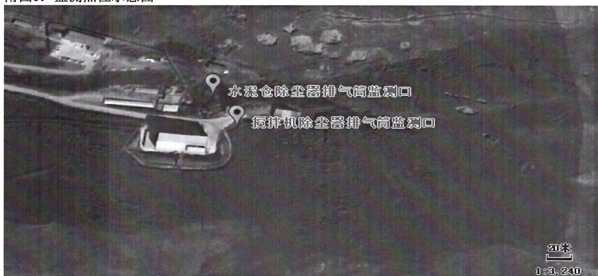
附图1: 监测点位示意图