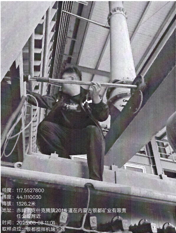
搅拌机除尘器排气筒监测口