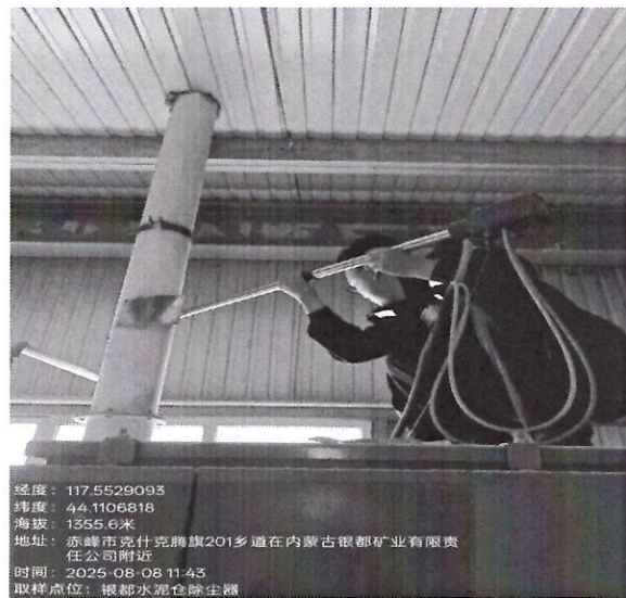
水泥仓除尘器排气筒监测口