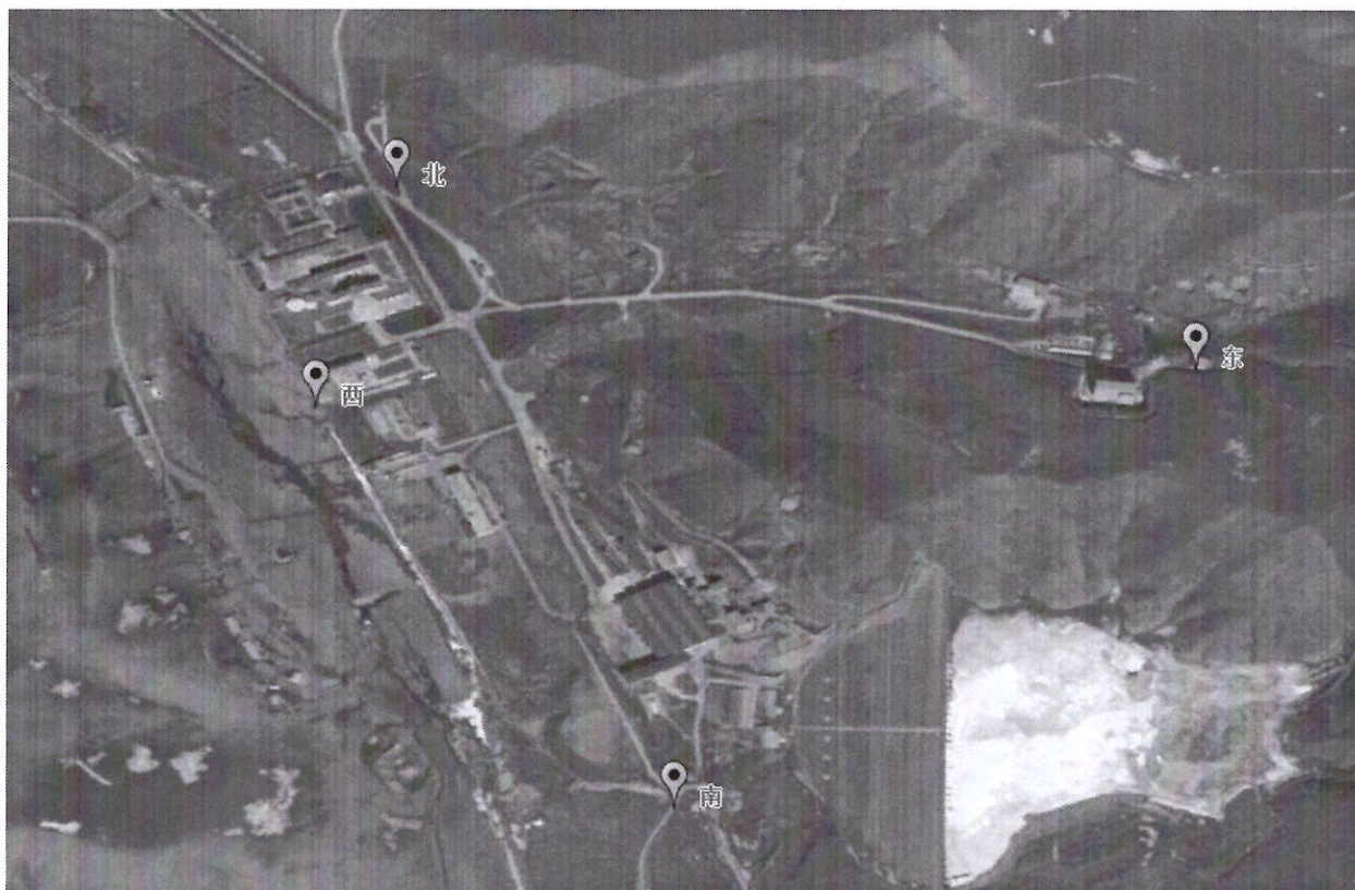
附图 2: 监测点位示意图