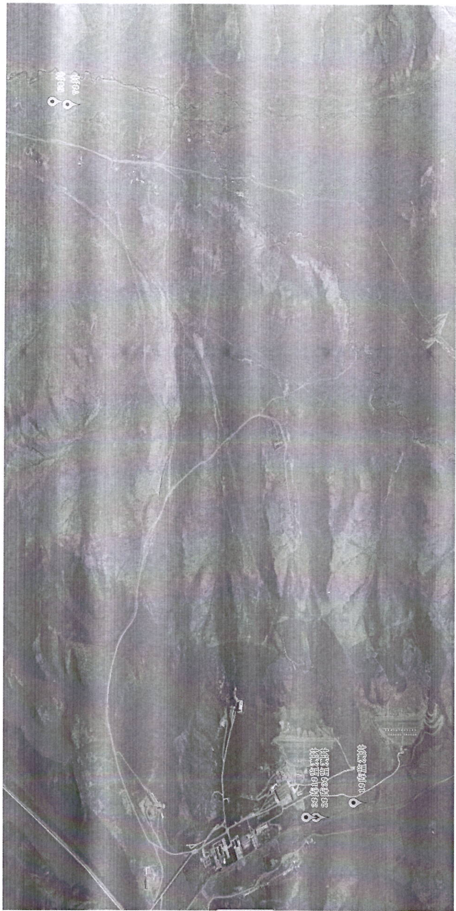
地下水检测点位图